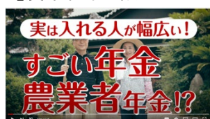
【農業者年金設計メリット編】

今後、こちらの動画を使用したいという業務受託機関の皆さまがいらっしゃいましたら、京都府農業会議までご連絡をお願いいたします。