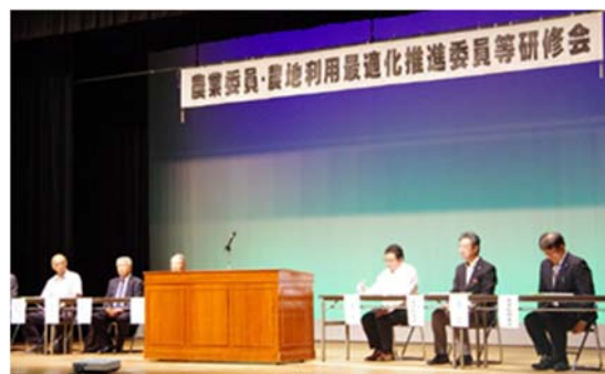
東三河会場（豊川市文化会館）

県内の農業委員及び農地利用最適化推進委員を対象に、令和7年度農業委員・農地利用最適化推進委員等研修会を開催しました。9月5日に予定していました尾張会場については、残念ながら台風15号の影響が懸念されたため中止としましたが、西三河会場及び東三河会場には、合わせて611名の委員の方々に出席いただきました。