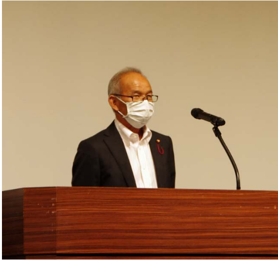
主催者あいさつ 外山西三河協議会長（西尾市）