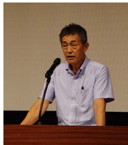
研修：愛知県農業振興基金 （篠辺農地集積推進部長）