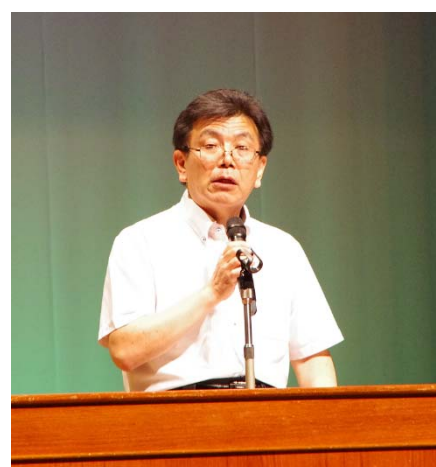
研修：農業振興基金 （岩田農地第6課長）