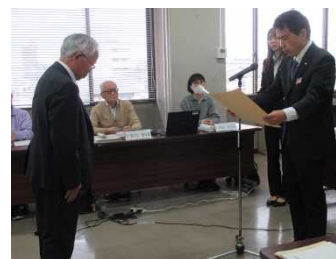
石原会長への伝達式