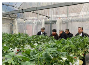
ささはら菜園視察

1月28日、29日に、令和7年度全国農業委員会都市農政対策協議会現地研修・研究会が全国農業会議所と兵庫県農業会議の共催により尼崎市において開催されました。