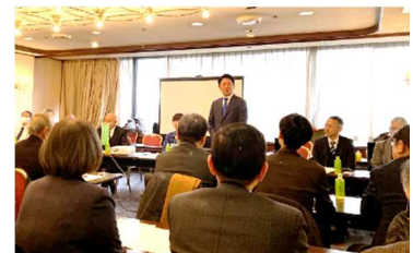
尼崎市長挨拶（研究会）